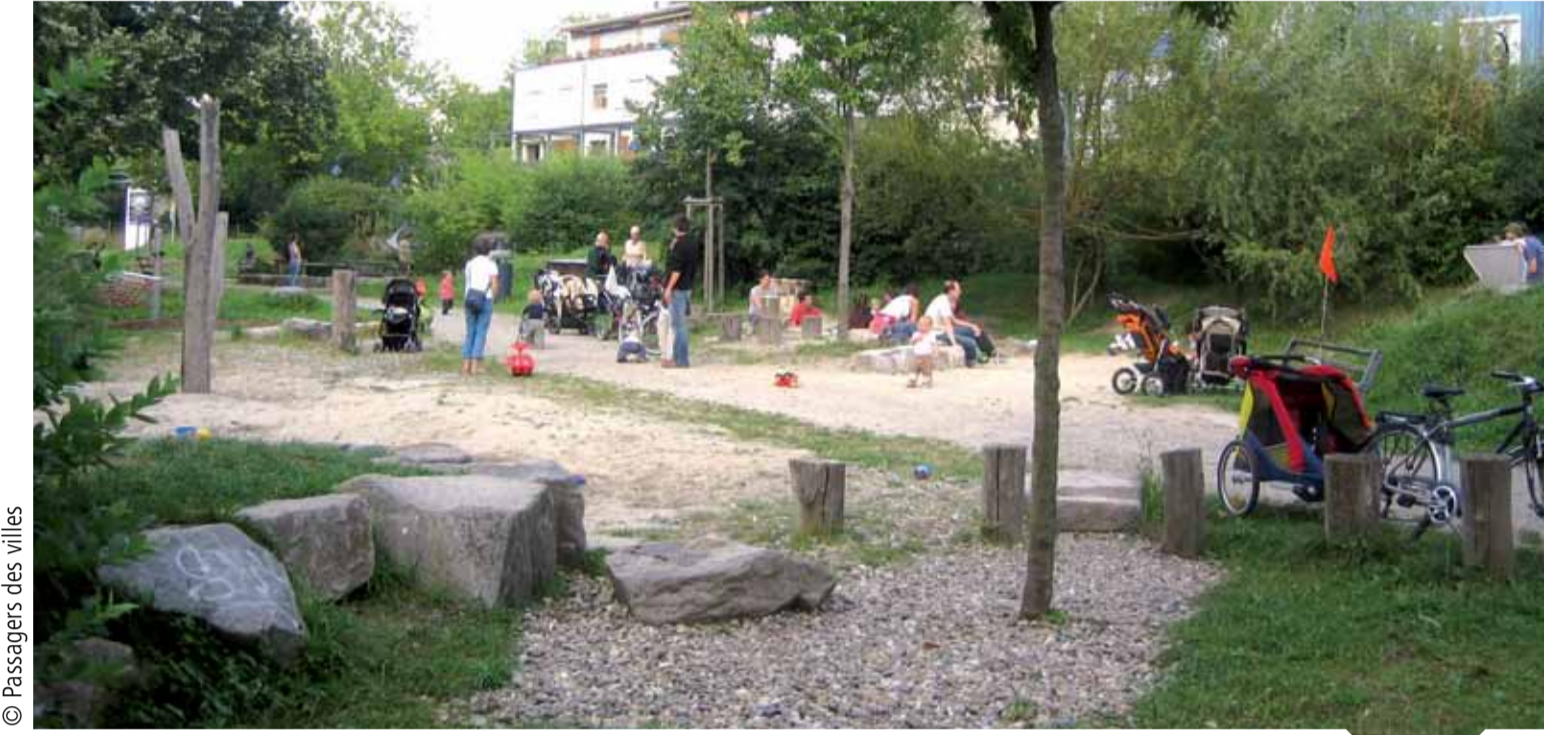
Le quartier Vauban, à Fribourg Un quartier parcouru de cheminements piétons et de pistes cyclables sécurisées qui facilitent les déplacements doux comme la marche, le vélo, le roller, etc.