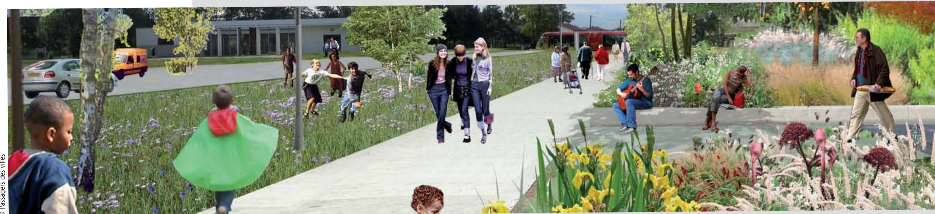
Le jardin Pixel Il relie la place au square.

Trois cheminements piétons transforment le quartier en zone « marchable ». Les enfants peuvent aller à l'école ou jusqu'aux terrains de sport à pied, en toute sécurité.