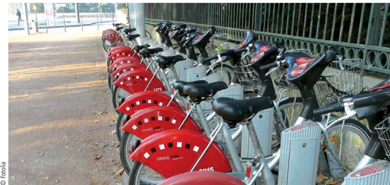
Le Vélo'v à Lyon Les Lyonnais ont été les premiers à tester à grande échelle le système de location de vélos en libre service. Une initiative qui a fait doubler le trafic vélo.

Le chiffre clé 60% des déplacements en ville se font en voiture particulière (source Ademe).