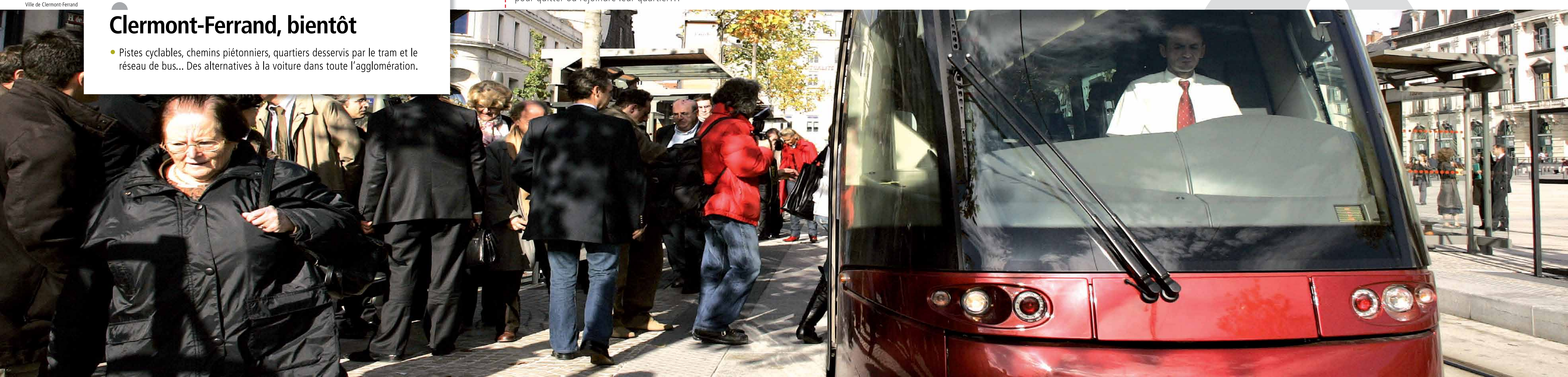
La rue Mabrut, rue interquartier